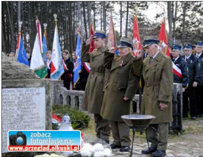
zobacz fotorelację na www.przegląd.olkuski.pl